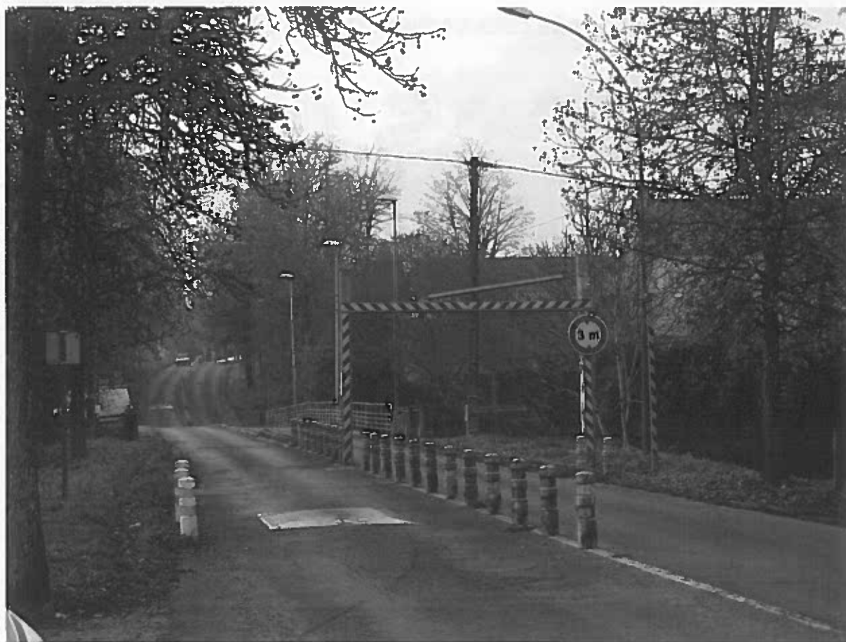
Photographie 1 - 2018